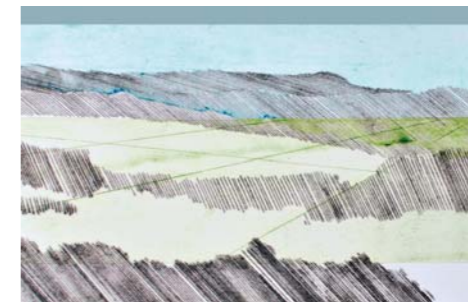
Druckdesign Anja Klafki

Zum 13. Mal findet der Kunstwettbewerb „Ortszeit“, mit dem Jahresthema BEWEGT für Künstler*innen aus der Region Nordschwarzwald statt. Zu sehen ist die Ausstellung im Kreis Freudenstadt vom 02.-25.10.2021 in der GALERIE des Kunstverein Oberer Neckar, Marktplatz 28, 2. Stock, in Horb a.N. Gezeigt werden die Werke von 40 Künstlerinnen und Künstler. Unter ihnen die Preisträger des Wettbewerbes.